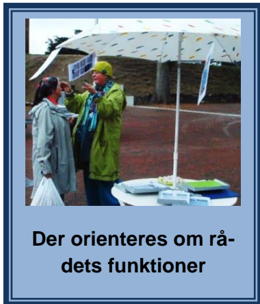
Der orienteres om rådets funktioner

Lokalrådet har deltaget i markedsdagen for at orientere om, hvad vi står for, og hvilke forventninger der kan stilles til vort virke.