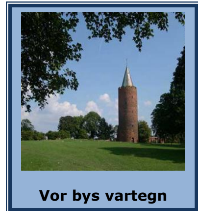
Vor bys vartegn

Lokalrådet har deltaget i markedsdagen for at orientere om, hvad vi står for, og hvilke forventninger der kan stilles til vort virke.