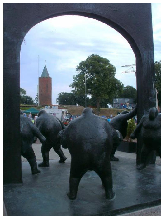
Vordingborgs byport 2013

I oktober måned forudser vi at afholde et borgermøde, hvor hovedtemaet bliver den kommende ITverden, idet digitaliseringen ved udgangen af 2013 vil omfatte: Begravelseshjælp, Friplads i dagtilbud, Hjælpemidler, Udrejse, Kørekort/Pas (i Borgerservice), Navne- og adressebeskyttelse, Skadedyrsbekæmpelse, Lån til ejendomsskatter, Sygedagpenge (kun oplysningsskema), Udlån/leje af lokaler/ejendomme, Valg af læge, vielse/ Partnerskab. I 2014 udvides der igen med yderligere områder, så kendskab til benyttelse af elektronisk udstyr bliver et krav, når man skal ændre status. Der vil blive annonceret i lokalpressen.